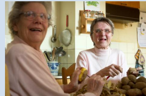
Eindrücke aus den ambulant betreuten Wohngruppen in Damflos und Marienrachdorf

Das Projekt wird durchgeführt im Rahmen des Zukunftsprogramms Pflege und Gesundheit 2020